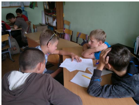
Зачем человеку каникулы?