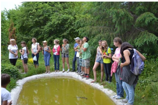
В ботаническом саду.