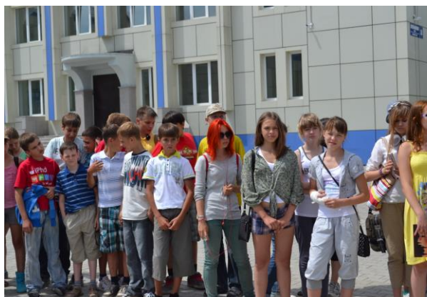
До свиданья лагерь, до свиданья друзья.