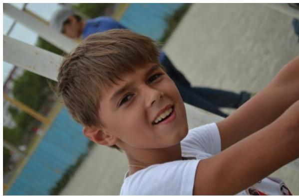
Лучше всех играю я, футбол это жизнь моя.