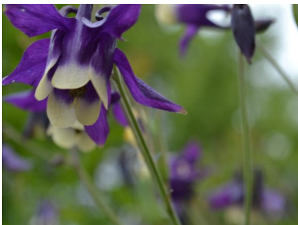
Мир деревьев цветов и трав.