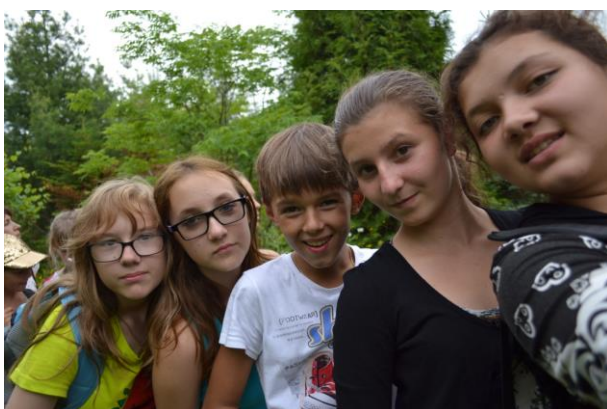
Мир деревьев цветов и трав.