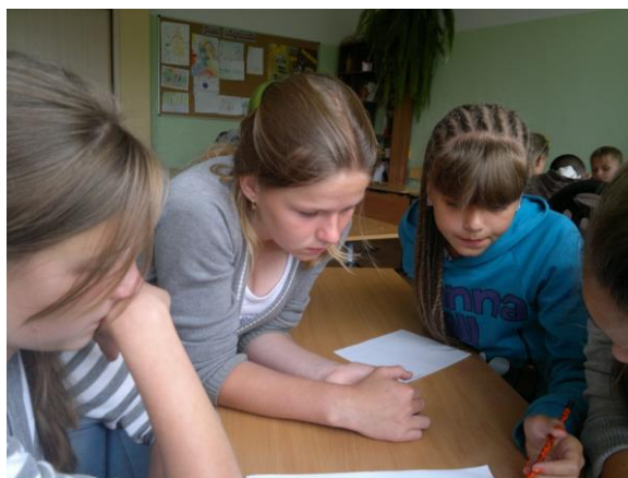
Как много нам открытий чудных...