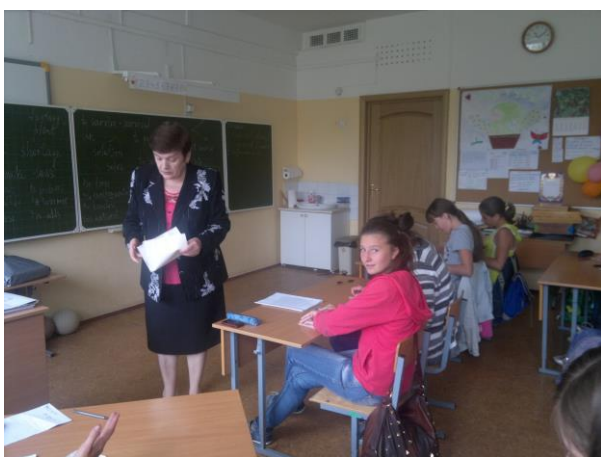
Встреча с врачом.