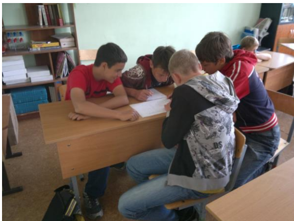
Готовит просвещения дух...