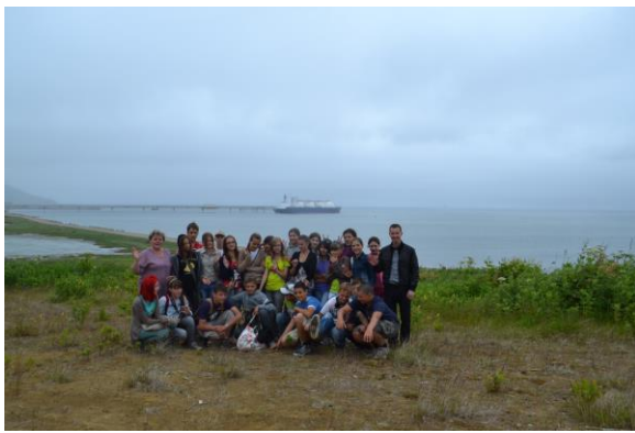
Экскурсия на СПГ.