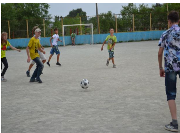
Всех позвал на стадион.