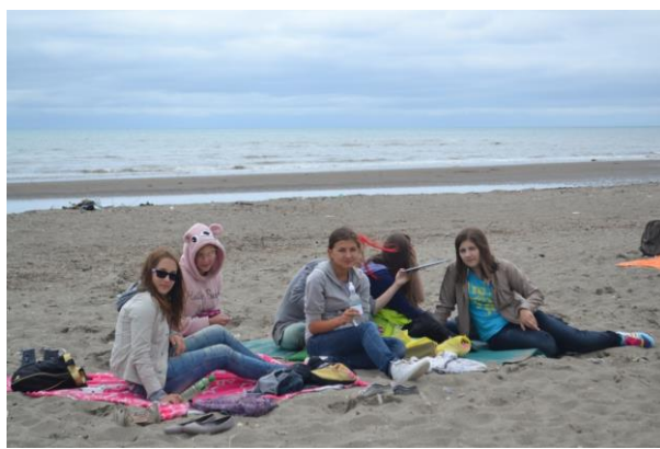
Море, море – мир бездонный.