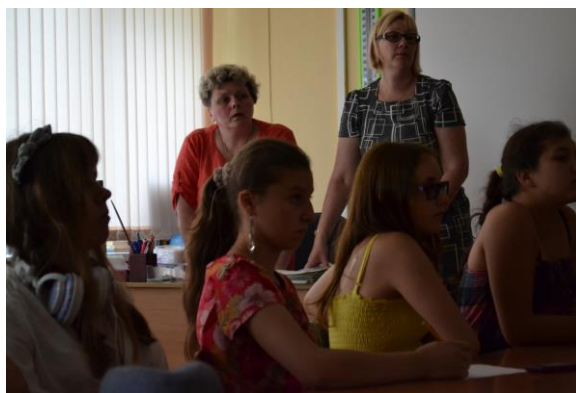
Наши любимые учителя.