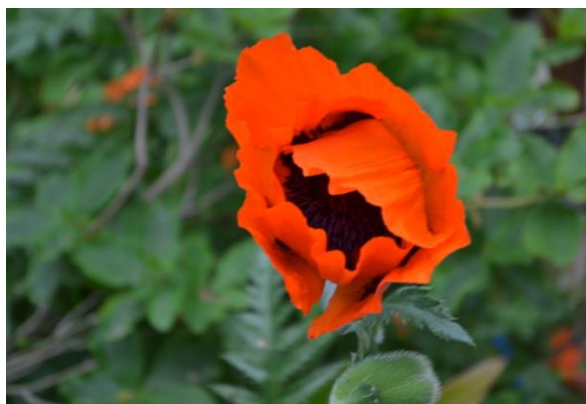
Мир деревьев цветов и трав.