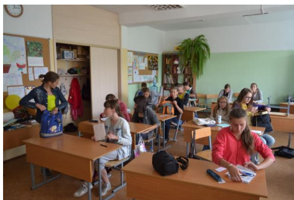
Свободное время в лагере явление редкое.