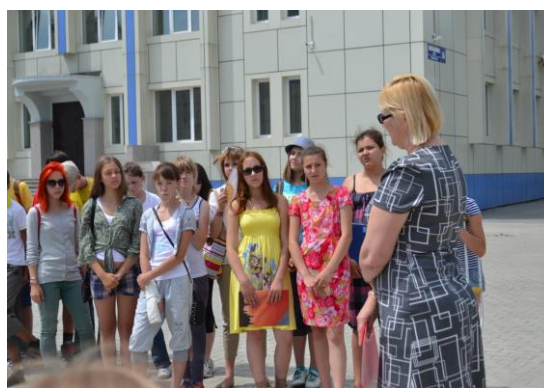
Торжественное открытие лагеря.