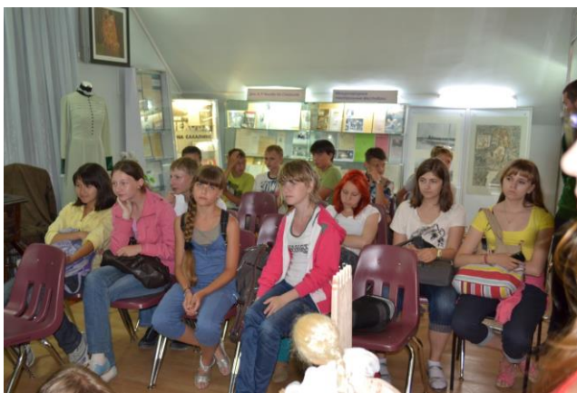
В музее им А.П. Чехова.