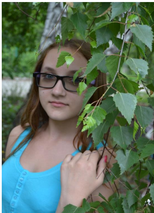
Береза- символ России.