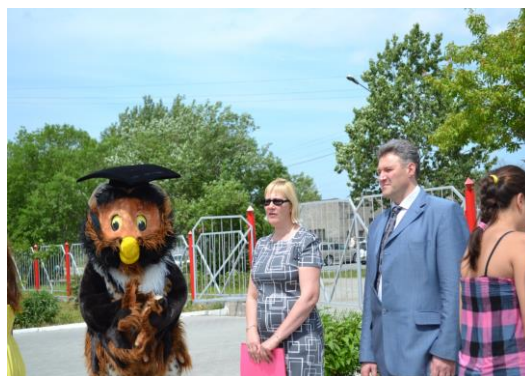
Приветствие почетных гостей.