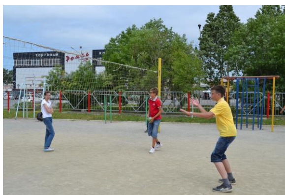
Ура! Мы выиграли в пионербол.